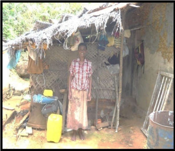
අගලවත්ත ප්‍රා.ලේ.කොට්ටාශයේ ඩී.කුමුදුනි මහත්මිය ජීවත් වූ පැරණි නිවස

දිරිය ලියට නිවාස වැඩ සටහන ක්‍රියාත්මක වූ ආකාරය