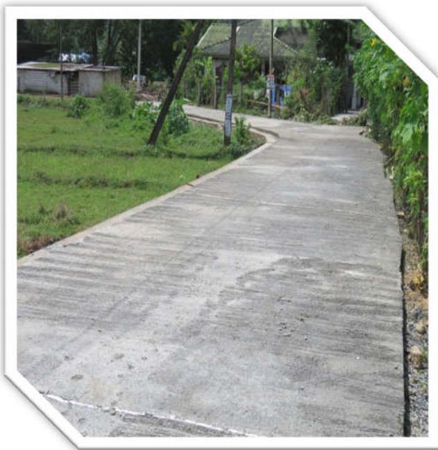
❖ මේදන්කර පාර කොන්ක්‍රීට් කිරීම 610 ඒ - අරමනාගොල්ල

ග්‍රාමීය යටිතල පහසුකම් සංවර්ධන වැඩසටහන යටතේ ක්‍රියාත්මක වූ ව්‍යාපෘති 2ක් පහත දක්වේ.