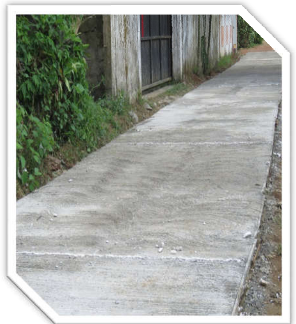
සොයිසාවත්ත පළවන පටුමග කොන්ක්‍රීට් කිරීම 604 - කෝරළඉම