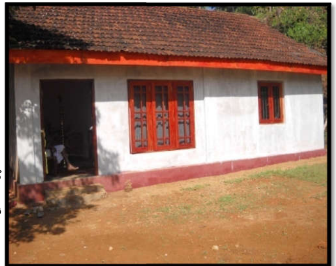
අගලවත්ත ප්‍රා.ලේ.කොට්ටාශයේ ඩී.කුමුදුනි මහත්මියගේ නව නිවස