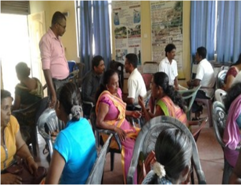
பாடசாலை சிறுவர் பாதுகாப்பு குழுக்களுடனான நிகழ்ச்சித்திட்டங்கள்