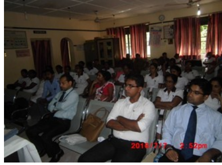
கல்வியல் கல்லூரி ஆசிரிய மாணவர்களை விழிப்புணர்வூட்டல் புலத்சி கல்வியியற் கல்லூரி