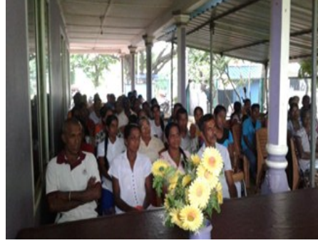
சுகாதார ஊழியர்களை விழிப்புணர்வூட்டல்-மெதிரிகிரிய