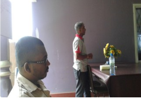
சிவில் பிரஜைகளை விழிப்புணர்வூட்டல்- லங்காபுர

சமூர்த்தி பயனாளிகளை விழிப்புணர்வூட்டல் - திம்புலாகல