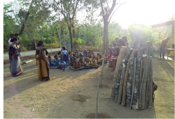
முன்பள்ளி ஆசிரியைகளை தெளிவூட்டும் நிகழ்ச்சிகள்