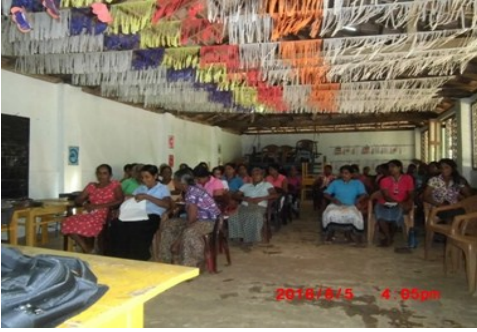
வாழ்வின் எழுச்சி அபிவிருத்தி உத்தியோகத்தர்களை -மெதிரிகிரிய