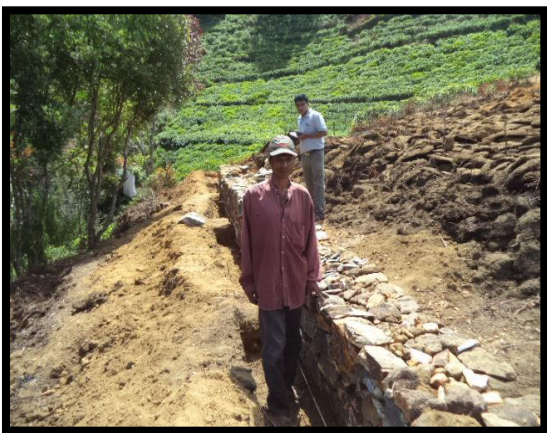
රත්නපුර දිස්ත්‍රික්කය ඉඹුල්පේ ප්‍රාදේශීය ලේකම් කොට්ඨාශය

මෙම වැඩසටහන මගින් ජලපෝෂක ප්‍රදේශ, ගං ඉවුරු හා වැව් රක්ෂිත වැනි අත්‍යාවශ්‍යයෙන්ම සංරක්ෂණය කළයුතු ප්‍රදේශත්, පාංශු සංරක්ෂණය කළයුතු හා කෘෂිකාර්මික ගෙවතු වල පස සංරක්ෂණ කටයුතු ඉතාමත් සාර්ථක ක්‍රියාවට නැංවීය. මෙම ව්‍යාපෘතිවල ප්‍රගතිය දැක්වෙන ඡායාරූපමෙහි පහත දැක්වේ.