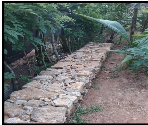
මාතර දිස්ත්‍රික්කය - කොටපොල ප්‍රාදේශීය ලේකම් කොට්ඨාශය