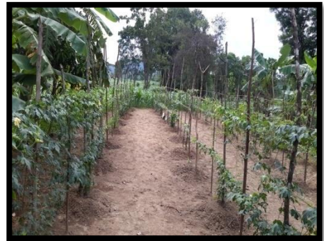
කළුතර දිස්ත්‍රික්කය - දොඩංගොඩ ප්‍රාදේශීය ලේකම් කොට්ඨාශය