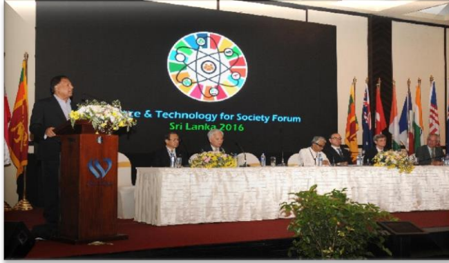
“சமுதாயத்திற்கான விஞ்ஞானம் மற்றும் தொழில்நுட்பம்” என்ற தலைப்பில் நடாத்தப்பட்ட வேலைத்திட்டம் தொடர்பில் கலந்துகொள்ளுதல்

ஜனாதிபதி செயலகத்தின் அறிவிப்பின் கீழ் விசேட பணிப் பொறுப்பு கௌரவ அமைச்சர் அவர்கள் உள்ளூர்க் கருத்தரங்குகள், கூட்டங்கள், வேலைத்திட்டங்கள் போன்றவை தொடர்பில் அதிமேதகு ஜனாதிபதி அவர்களைப் பிரதிநிதித்துவப்படுத்தி கலந்து கொண்டார். 2016 ஆம் ஆண்டில் அவ்வாறான தேசிய மட்டத்தின் 30 தடைவைகள் கௌரவ அமைச்சர் அவர்களினால் இற்றை வரையில் அதிமேதகு ஜனாதிபதி அவர்கள் பிரதிநிதித்துவப்படுத்தப்பட்டுள்ளமை குறிப்பிடத்தக்கதாகும்.