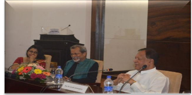
பண்டாரநாயக்க ஞாபகார்த்த சர்வதேச மகாநாட்டு மண்டபத்தில் நடாத்தப்பட்ட “2016 சார்க் மகாநாடு”