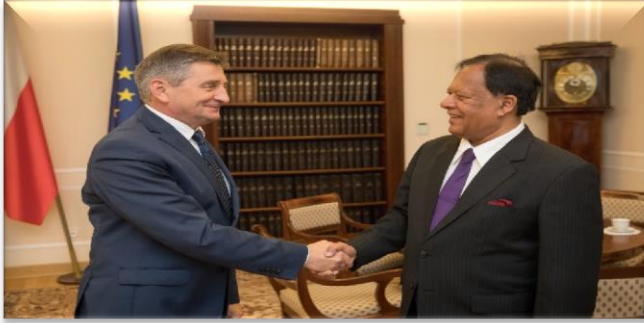
போலந்து அரசின் அழைப்பிதழின் பேரில் “ஆசியா - சாந்திகர தினம்” பிரதம பேச்சாளராக கலந்துகொள்ளுதல்.

இந் நிகழ்ச்சித் திட்டத்தின் கீழ் பிரதான முன்னேற்றக் கூட்டியாக இனங்காணப்பட்டிருப்பது, அதிமேதகு ஜனாதிபதி அவர்களினால் சந்தர்ப்பத்திற்கேற்ப அமைச்சுக்கு முன்வைக்கப்படும் விசேட பணிகளின் எண்ணிக்கை என்பதுடன், அவ்வெண்ணிக்கை முன்பு நிச்சயித்துக் கொள்ள முடியாதிருந்ததுடன் சந்தர்ப்பத்திற்கேற்ப தீர்மானிக்கப்படும். அவ்வாறு அமைச்சுக்கு முன்வைக்கப்படும் சகல விசேட பணிகளும் அப்பணியின் தன்மைக் கேற்ப தீர்மானிக்கப்படும் குறிப்பிட்ட கால வரையறையினுள் நிறைவு செய்தலினை இலக்காகக் கொண்டு அமைச்சினால் திட்டம் தயாரிக்கப்பட்டு அமுற்படுத்தப்பட்டு வருகின்றது.