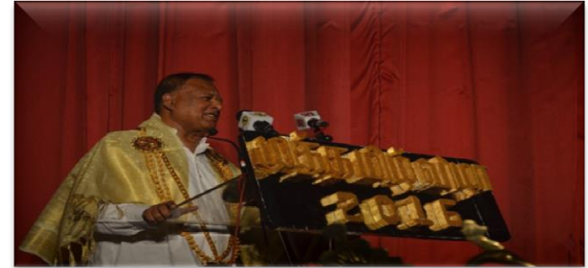
தமிழ் புலமைச் சங்கத்தினால் ஒருங்கிணைப்புச் செய்யப்பட்ட “முத்தமிழ் - 2016” நிகழ்வில் பிரதான விருந்தினராகக் கலந்துகொள்ளுதல்