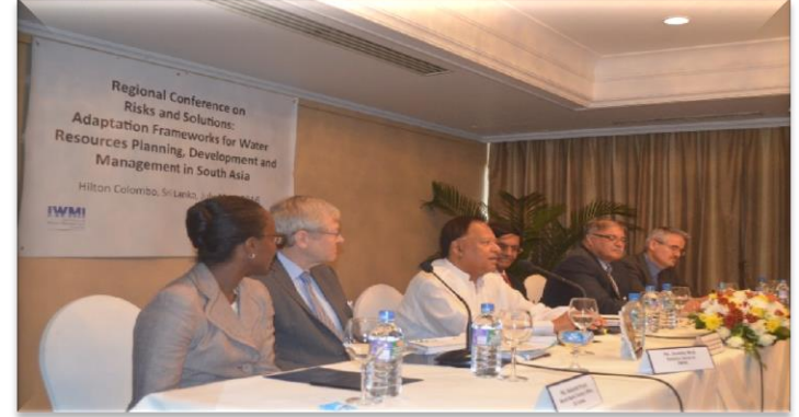
தெற்காசியாவின் நீர்வள முகாமைத்துவம் தொடர்பில் பிராந்திய மகாநாட்டில் பிரதானமான பேச்சாளராக கலந்துகொள்ளுதல்