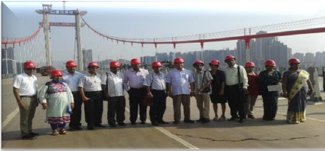
புதிய தொழில்நுட்பப் பூங்கா எண்ணக்கரு கற்கை ஆய்வு - சீன உத்தியோகப்பூர்வச் சுற்றுலா