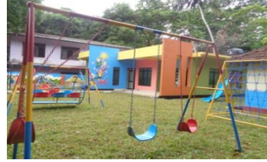
மாத்தளை பகல்நேர பராமரிப்பு நிலையம்