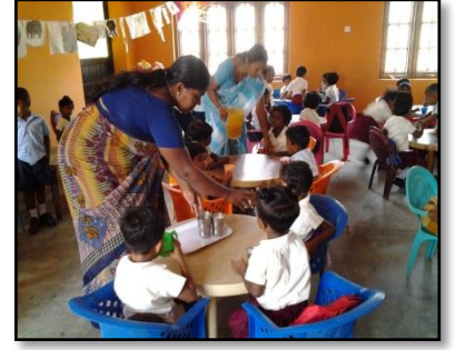
பாலர் பாடசாலை பிள்ளைகளுக்கு ஒரு கிளாஸ் பசும்பால் வழங்கும் நிகழ்ச்சித்திட்டம்