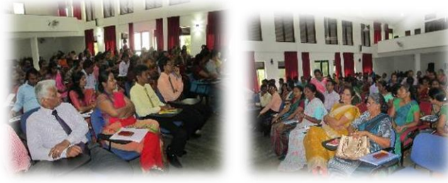
தலாஹேன முன்னேற்ற மீளாய்வு கூட்டத்தின் விஷேட சந்தர்ப்பங்கள்

25 மாவட்டங்களுக்கும் ஒவ்வொரு மாவட்டத்துக்கென மாவட்ட ஒருங்கிணைப்பு பதவி நிலை அலுவலர் ஒருவர் நியமனம் செய்யப்பட்டுள்ளார் என்பதுடன் ஆகக்குறைந்தது ஒரு வருடத்துக்குள் 2 தடவையேனும் குறித்த மாவட்டத்தின் முன்னேற்ற மீளாய்வை மேற்கொண்டு அறிக்கையொன்றை சமர்ப்பித்தல் வேண்டும். இந்த நிகழ்ச்சித்திட்டம் தற்போது மிக வெற்றிகரமாக அமுல்படுத்தப்பட்டு வருவதுடன் மேலும் இந்த செயன்முறையை வலுவூட்டும் பொருட்டு 25 மாவட்டங்களிலும் மாவட்ட வெளிக்கள அலுவலர்கள் சகலருக்கும் முன்னேற்ற மீளாய்வு மற்றும் திறன் அபிவிருத்திக்கான 2 நாள் நிகழ்ச்சித்திட்டம் ஒன்று கொழும்பில் நடாத்தப்பட்டது. அதனுடாக அபிவிருத்தி நிகழ்ச்சித்திட்டங்களின் நிதிசார் மற்றும் பௌதீக முன்னேற்றம் பற்றி ஆராயப்பட்டதுடன் அமுல்படுத்தும் போது எழுகின்ற சிக்கல்கள் - தேவை களை இனங்கண்டு அவற்றை தவிர்த்துக் கொள்வதற்கான ஆலோசனைகளும் பெற்றுக்கொடுக்கப்பட்டன.