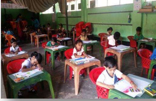
“அருண தக்கின ரட்டா” பிரதேச நிகழ்ச்சித்திட்டம்

தெரிவு செய்யப்படுகின்ற தகுதிவாய்ந்த சித்திர ஆக்கங்கள் மூலம் தேசிய மட்டத்திலான “அருண தக்கின ரட்டா” சித்திர செயர்வு மற்றும் பரிசு வழங்கும் வைபவத்திற்கு சித்திரங்களை தெரிவு செய்துகொள்வதற்கான 25 நிகழ்ச்சித்திட்டங்கள் மாவட்ட மட்டத்தில் நடாத்தப்பட்டுள்ளன. அதற்கமைய இந்த நிகழ்ச்சித்திட்டத்திற்கு மதிப்பீடு செய்யப்பட்ட மொத்தத் தொகையும் செலவிடப்பட்டுள்ளது.