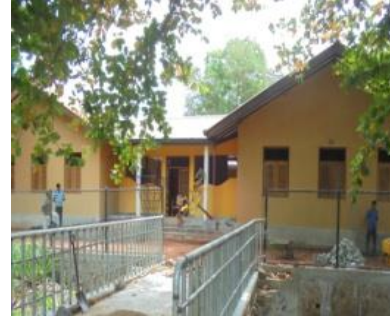
அநுராதபுரம் பகல்நேர பராமரிப்பு நிலையம்