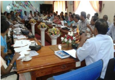
மாவட்ட சிறுவர் அபிவிருத்திக் குழுக் கூட்டங்களை நடாத்தல்

ஒவ்வொரு பொறுப்புவாய்ந்த பிரிவினதும் பங்கேற்புடன் சிறுவர்களுக்கு சாதகமான குழுவை உருவாக்குவதற்காக 2016 ஆம் ஆண்டு மாவட்ட சிறுவர் அபிவிருத்திக் குழுக் கூட்டங்களை நடாத்துவதற்கு ஒதுக்கப்பட்ட மொத்த ஏற்பாடுகளின் அளவு ரூ.மி. 0.75 ஆகும். அதற்கமைய 2016 ஆம் ஆண்டின் இறுதியில் 58 குழுக்களுக்கு ரூ.மி. 0.492 ஆன நிதிசார் முன்னேற்றம் அடையப்பெற்றுள்ளது.