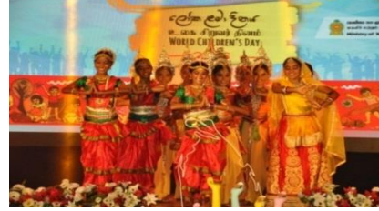
உலக சிறுவர் தின தேசிய வைபவம்